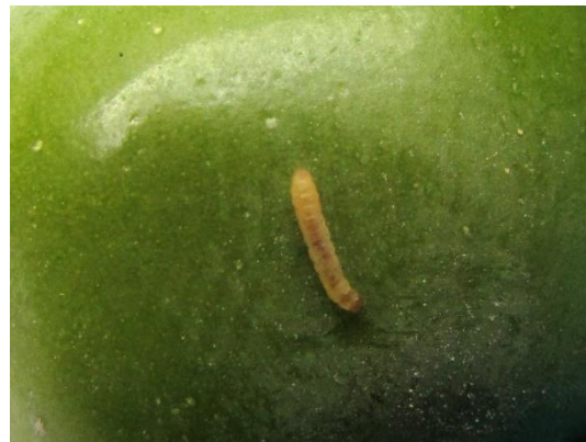
זחל של המזיק