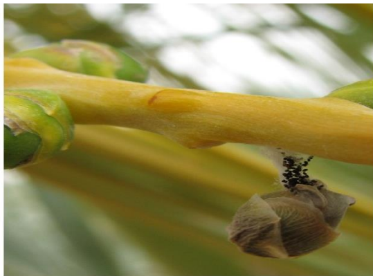
זק שנגרם מעש התמר הקטן

עש התמר הקטן (בטרחדרה) הוא מזיק ייחודי לתמר, הניזון מפרחים ומפירות תמר שלא הגיעו לבשלות. תעופת הזכרים בערבה מתחילה לרוב בין אמצע חודש פברואר לתחילת מרס, וכשלושה עד ארבעה שבועות אחר כך כבר ניתן לזהות זחלים באשכולות. עד חודש יולי מקים העש שלושה-ארבעה דורות חופפים, ולאחר מכן נפסקת פעילותו עד האביב הבא. משך דור (מביצה לביצה) הוא כחודש ימים. הזחל חי כשבועיים, שבמהלכם הוא ניזון מהתפרחות ומהפרי וגורם לנשירתם. אוכלוסייה גדולה של העש עלולה להסב נזק כלכלי חמור, עד כדי אובדן חלק גדול מהיבול. הנזק נגרם בעיקר מחדירת הזחל לפרי באזור עלי הגביע, שאותה ניתן לזהות לפי הפרשת הגללים והקורים. לפני כניסתו לפרי, הזחל טווה עליו או בסנסן קורים דביקים. פרי שניזוק לרוב נושר או שנותר תלוי על הסנסן.