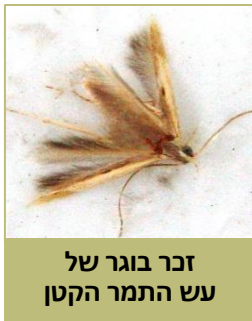
זכר בוגר של עש התמר הקטן

עש התמר הקטן (בטרחדרה) הוא מזיק ייחודי לתמר, הניזון מפרחים ומפירות תמר שלא הגיעו לבשלות. תעופת הזכרים בערבה מתחילה לרוב בין אמצע חודש פברואר לתחילת מרס, וכשלושה עד ארבעה שבועות אחר כך כבר ניתן לזהות זחלים באשכולות. עד חודש יולי מקים העש שלושה-ארבעה דורות חופפים, ולאחר מכן נפסקת פעילותו עד האביב הבא. משך דור (מביצה לביצה) הוא כחודש ימים. הזחל חי כשבועיים, שבמהלכם הוא ניזון מהתפרחות ומהפרי וגורם לנשירתם. אוכלוסייה גדולה של העש עלולה להסב נזק כלכלי חמור, עד כדי אובדן חלק גדול מהיבול. הנזק נגרם בעיקר מחדירת הזחל לפרי באזור עלי הגביע, שאותה ניתן לזהות לפי הפרשת הגללים והקורים. לפני כניסתו לפרי, הזחל טווה עליו או בסנסן קורים דביקים. פרי שניזוק לרוב נושר או שנותר תלוי על הסנסן.